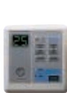
Receiver LCD Wireless Remote Control (ACYSTAT008B)