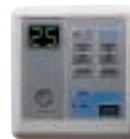
LED Wired Control (ACYSTAT007A)